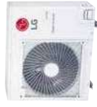
Multi F Buitenunit Voeding 230V + N